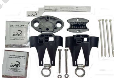
Kit entrada oval CEO-II FM