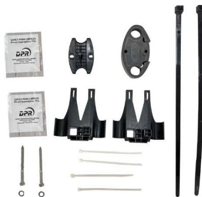
Kit entrada oval CEO-II FM