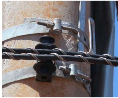
Sustentação de dois cabos ópticos