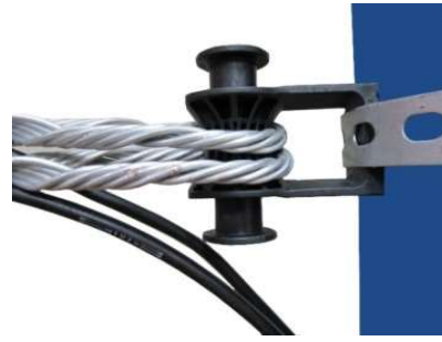
Ancoragem de dois cabos ópticos