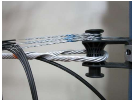
Ancoragem de cabo e drop óptico