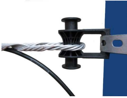
Ancoragem de um cabo óptico